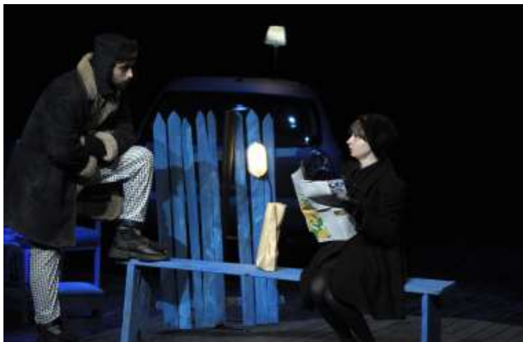
Scenă din spectacolul Aproape