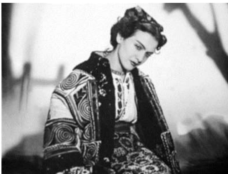
Zilele Mariei Tănase, vineri și sâmbătă, la Teatrul Nottara din Capitală

Teatrul Nottara din București organizează, vineri și sâmbătă, Zilele Mariei Tănase, pentru a sărbători 100 de ani de la nașterea uneia dintre cele mai îndrăgite și apreciate interprete de muzică populară din România, informează un comunicat.